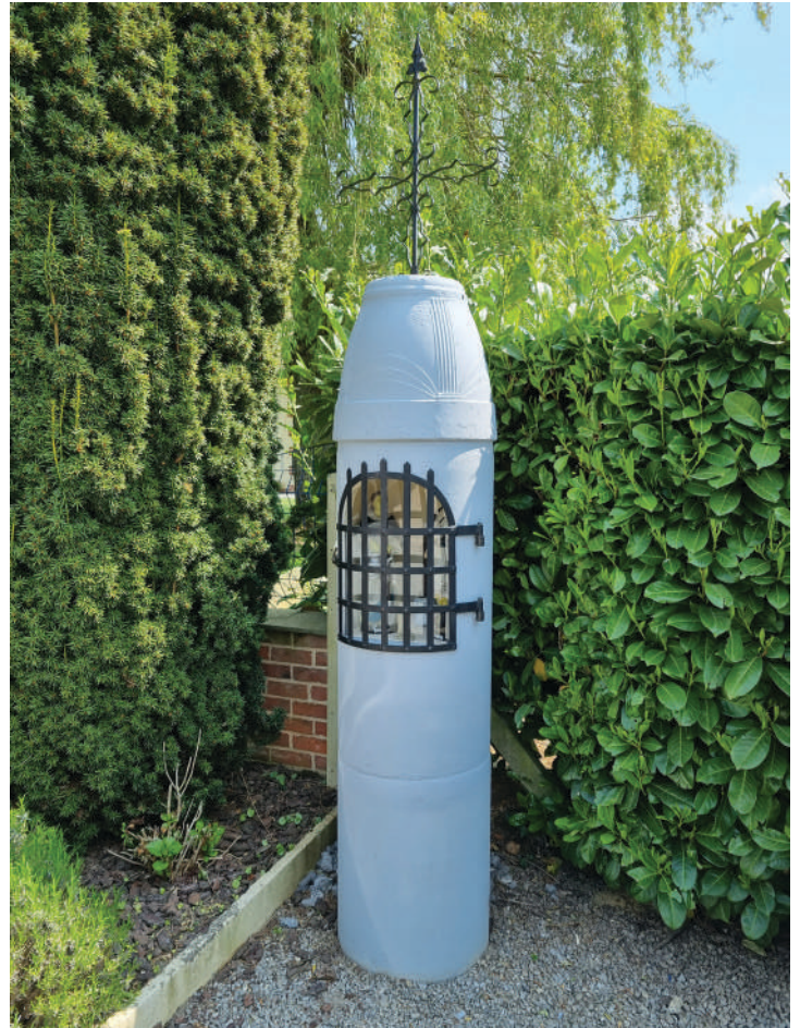
Texte et photo : Philippe Dequesne

Reste une petite icône pieuse de Jérusalem que la grand-mère de mon épouse a ramené d'un pèlerinage.