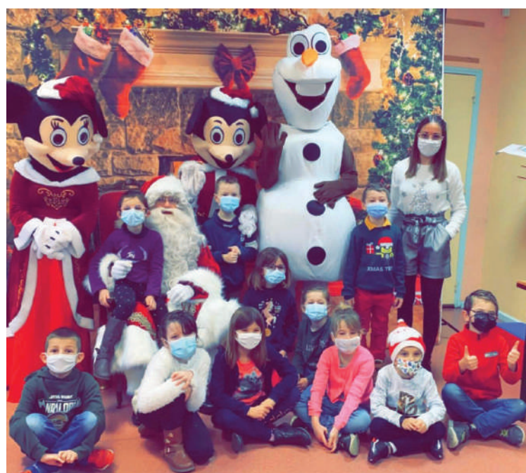
Visite à l'école organisée par Sémeries en Fête

Lors de cette réunion, de nouveaux membres se sont présentés et ont été chaleureusement accueillis.