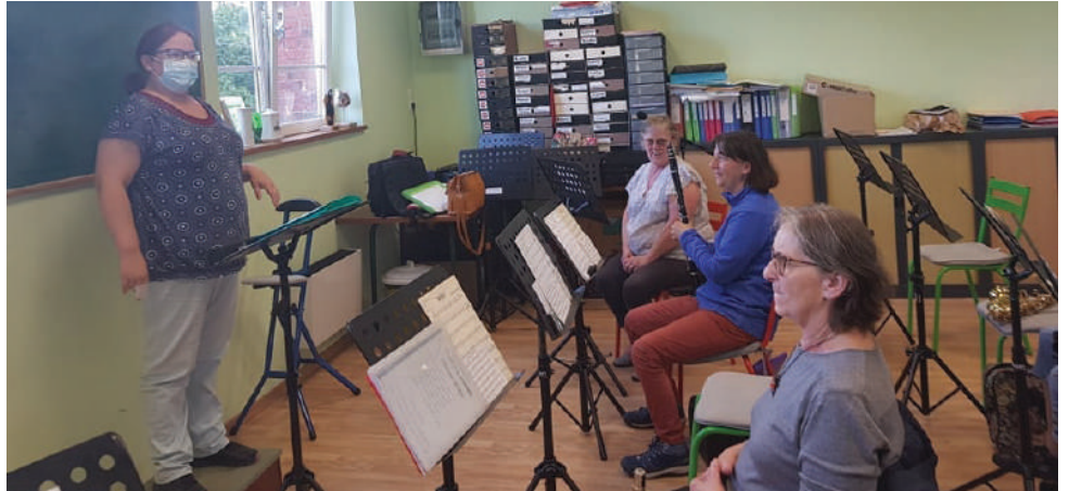
Les battants de Sol Si Do se produiront à la ducasse de Sémeries le 26 juin.

Et Rejoignez les musiciens sur leur page Facebook «Harmonie de Sémeries»